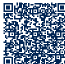
CCH Patient Portal