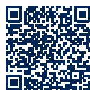
Sengstacke Health Center